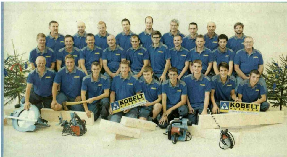
Die Belegschaft der Kobelt AG inklusive der fünf Lernenden.